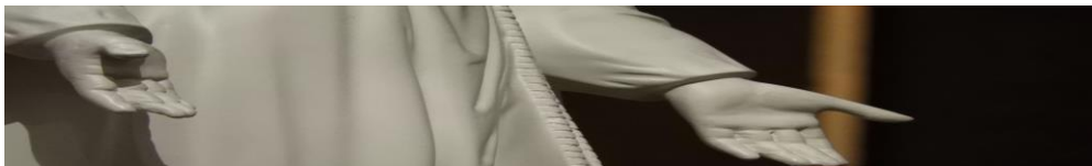
Sanctuaire Saint Jérôme de Toulouse Année Jubilaire 2025... « Pèlerins d'Espérance »

« Marie fut le premier tabernacle de l'histoire, elle qui a formé en son sein le Corps de Jésus et l'a mis au monde ; elle l'a fait grandir et embelli de vertus par l'éducation ; elle l'a reçu au pied de la Croix, puis adoré après sa résurrection. Tout ce qui concerne le Corps de Jésus est en relation directe avec le cœur de Marie : comment ne ferait-elle pas tout pour que nos âmes se nourrissent de son Fils, que nous soyons transformés en lui ? » Pape François, exhortation Evangelii Gaudium